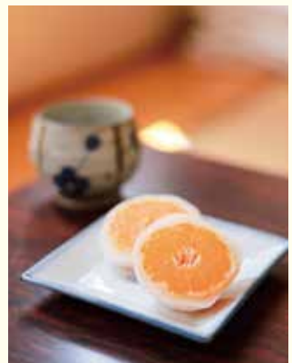
まるごとみかん大福

会場 東温市さくらの湯観光物産センター(東温市北方) 料金 1個180円(税込み) 問 東温市さくらの湯観光物産センター ☎993-8054