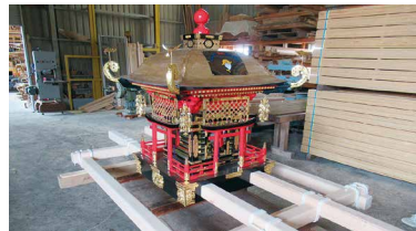
整備した中西内区のみこし

(一財)自治総合センターの宝くじ受託事業収入を財源としたコミュニティ助成事業を活用し、地域コミュニティのための備品を整備しました。 ▶中西内区=祭り用具(みこし) ▶出合町内会=祭り用具(みこし) ▶下苅屋町内会=コミュニティ活動用具(机、椅子、コピー機など) 問 まちづくり推進課 ☎948-6963・FAX934-1821