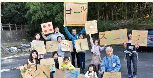
参加した小学生とDOOR研究生