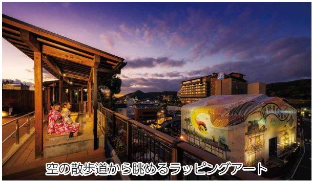
空の散歩道から眺めるラッピングアート

これからもプロジェクトを通し て、道後温泉本館の歴史的、また文 化的価値や保存修理工事の魅力を発 信していきます。