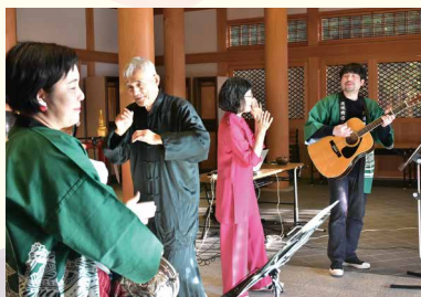
「道後気功念仏踊り」の様子

プロジェクトで交流した目や耳が不自由な人から、事前に募集したコロナに関する歌詞を書いた紙人形を宝蔵寺本堂内に設けた踊り舞台に並べました。それぞれ、その歌詞をリアルタイムで歌い、その音楽の振動で参加者の分身である紙人形を踊らせました。