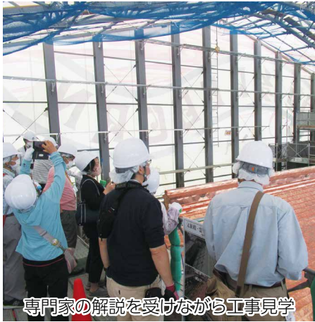
専門家の解説を受けながら工事見学

重要文化財の保存修理工事を期間 限定の観光資源として磨き上げ、ア ニメーションや工事見学会で発信 し、地域の「ピンチ」を「チャンス」 に変えている点が評価されました。