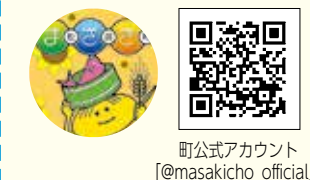
町公式アカウント @masakicho_official