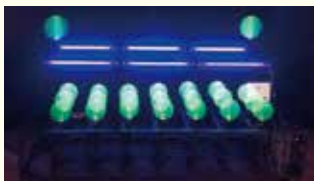
三好 滋「円と光と動き」

日時 4月17日(土)～8月29日(日)(予定) ※休館日＝月曜日、祝日の翌日 会場 町立久万美術館(久万高原町菅生) 内容 県内現代作家の作品展示 料金 一般500円、高校・大学生400円、小・中学生300円 問 町立久万美術館 ☎0892-21-2881