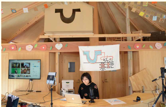
ひみつジャナイ基地でオンライン配信

「障がいのある人の作品が道後に飾られることに驚いた。そのことで、『道後への愛着がさらに湧いた』という声が多く寄せられたことがうれし」