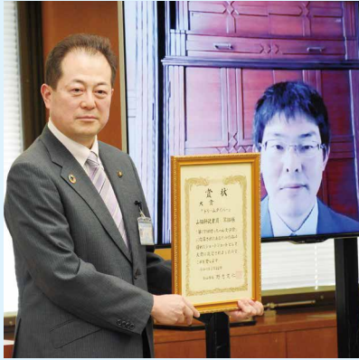
オンラインで表彰を受ける 山猫軒従業員・黒猫さん(右)