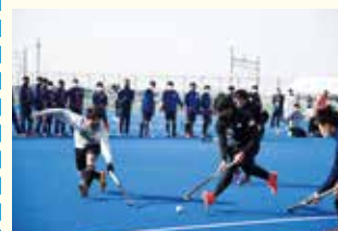
代表選手に教えてもらった ホッケークリニック