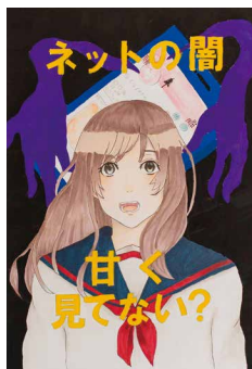
令和元年度 一般の部最優秀賞作品