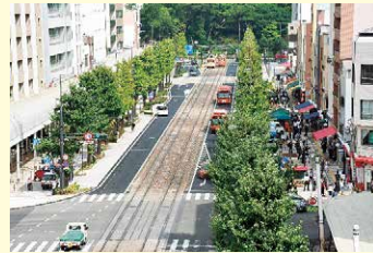
「審査員特別賞」 「花園町通りまちづくり活動」