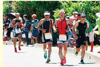
「きらめき奨励賞(まちなみ・まちづくり部門)」 「トリアアスロン中島大会」