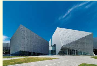
「きらめき奨励賞(建築部門)」 「ミウラ愛サイト(右)」「ミウラ愛サウンド(左)」

※選考結果は令和3年1月ごろ受賞者へ通知し、市ホームページなどで公表します。受賞者には表彰状と記念品、受賞物件の推薦者には記念品を贈呈します