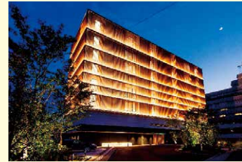
「きらめき大賞」 「宝荘ホテル」「道後御湯」