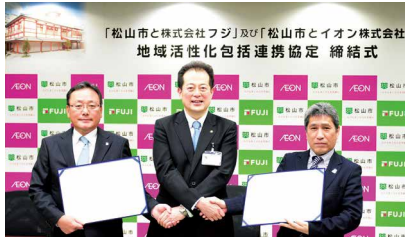
連携協定締結の様子