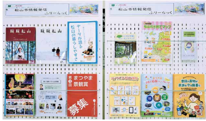
イオンスタイル松山

●(株)フジ フジグラン松山、フジ夏目店 フジ和気店、フジ安城寺店 フジ姫原店、フジ北斎院店 フジ松江店、フジ垣生店 フジ松末店、フジ道後店 ●イオンスタイル(株) イオンスタイル松山 ☎948-6705・FAX934-2578 ☎948-6705・FAX934-2578 ☎948-6705・FAX934-2578