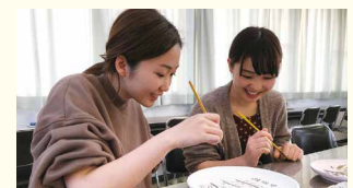
絵付け体験の様子

日時 9～17時(入館は16時まで) ▶休館日=毎週木曜(祝日の場合はその翌日) 内容・料金 絵付け体験(300円～)、手びねり体験(1人1,500円～)、ロクロ体験(1人1,500円～) ※手びねり・ロクロ体験の場合は予約が必要 問 砥部町陶芸創作館 ☎962-6145