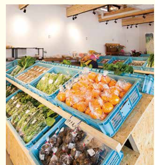
東温市さくらの湯 観光物産センター直売所