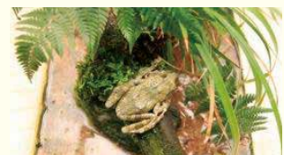
カジカガエルの飼育展示

日時 4月29日(水・祝)～6月21日(日) ※月曜休館 会場 面河山岳博物館 (久万高原町若山) 内容 博物館周辺のカエルとコケの生体展示ほか 料金 一般300円、小・中学生150円 問 面河山岳博物館 ☎0892-58-2130