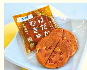
あわしま堂の「ピーなつ焼」が高機能おやつに！

会場 県内の各スーパー 料金 2枚入り110円(税別) 問 産業課商工水産観光係 ☎985-4120