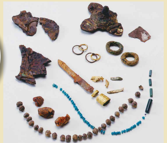
播磨塚天神山古墳出土品