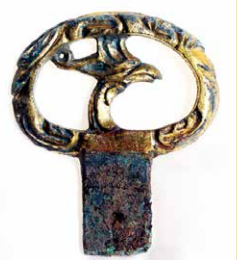
祝谷9号墳出土 大刀の柄飾り(鳳凰)