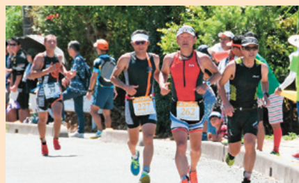
【きらめき奨励賞(まちなみ・まちづくり部門)】 トライアスロン中島大会 (中島本島)