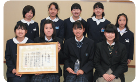
雄郡TCガールズ 2月4日受賞

2018全日本ジュニア・ユース 綱引選手権大会女子ジュニア 360kg以下 優勝