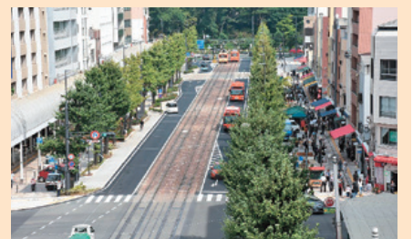
【審査員特別賞】 花園町通りまちづくり活動 (花園町)