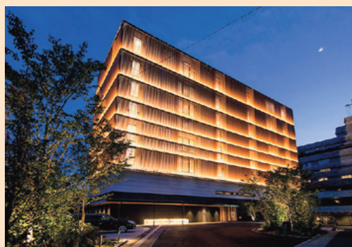
受賞物件・活動 【きらめき大賞】 宝荘ホテル 道後御湯 (道後鷹合町)

「まつやま景観賞」する「まつやま景観賞」第11回の今回は、合計76件の応募の中から、大賞1件、奨励賞2件、特別賞1件を決定し、2月20日に表彰式を開催しました。 式で梅岡副市長は「景観は市民の松山への誇りや愛着につながる」とあいさつし、受賞者らへ表彰状と記念品を授与しました。 また、市景観審議会は「審査を通して、まちが未来に向かって動いていることを感じた」と講評しました。