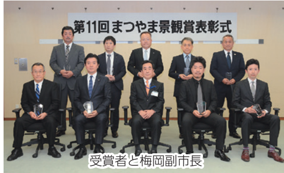
第11回まつやま景観表彰式 受賞者と梅岡副市長

申し込み 誕生日の前月1日(必着)までに、郵送・eメールで赤ちゃんの写真、氏名(ふりがな)、性別、生年月日、住所、電話番号(郵送の場合は写真の裏に記入)を、〒790-8571 シティプロモーション推進課 kkouho-baby@city.matsuyama.ehime.jpへ(応募多数の場合は抽選。応募写真は返却しません。なお、この紙面は市ホームページに掲載します)