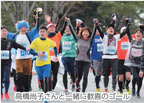
高橋尚子さんと一緒に歓喜のゴール