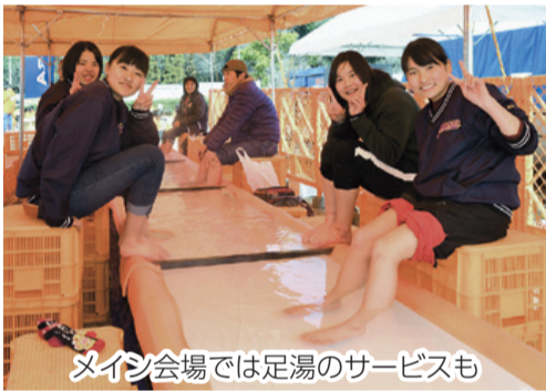
メイン会場では足湯のサービスも