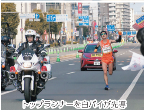
トップランナーを白バイが先導

2月10日に開催された第57回愛媛マラソン。今大会では、定員1万人に対し2万3,650人から応募をいただき、爽やかな青空のもと、1万318人が県庁前をスタート。日本全国、さらには海外から迎えた10代から80代までのランナーが、さっそうと伊予路を駆け抜けました。