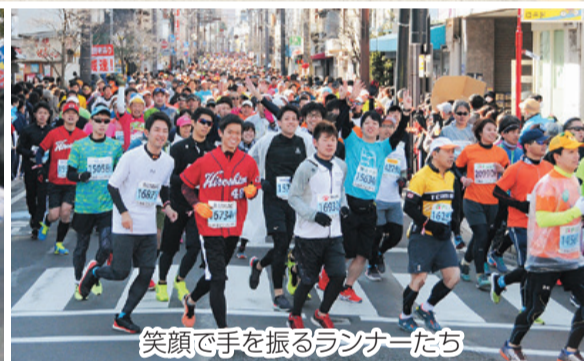
笑顔で手を振るランナーたち