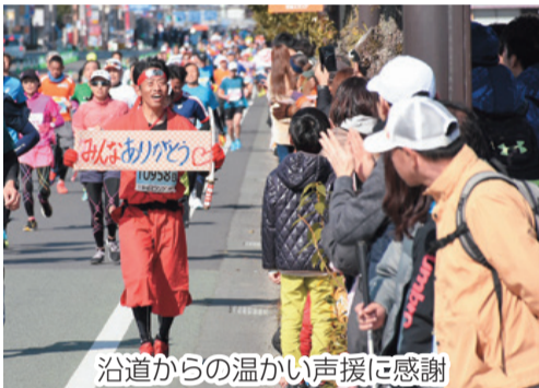
沿道からの温かい声援に感謝