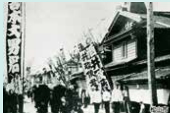
「大街道の新栄座」(一番町から大街道の入り口辺り。右手に芝居小屋「新栄座」。日露戦争時、松山に収容されたロシア兵捕虜の姿も見られる)

申し込み 3月19日(火)(必着)。電話・ファクス・はがき・eメール。住所、氏名、年齢、電話番号を〒790-0001 一番町三丁目20坂の上の雲ミュージアム「フィールドミュージアムツアー」係 sakakumo-museum@yon-b.co.jpへ