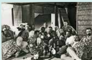
道後温泉でのロシア兵将校たち

日時 3月1日(金)～31日(日) 開館時間 = 9時～18時30分 (入館は18時まで)。月曜日休館 会場 坂の上の雲ミュージアム 2階ホール