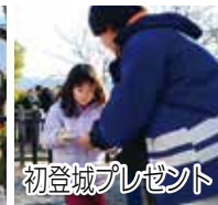
初登城プレゼント