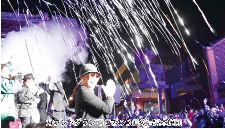
カウントダウンでにぎわう道後温泉本館前