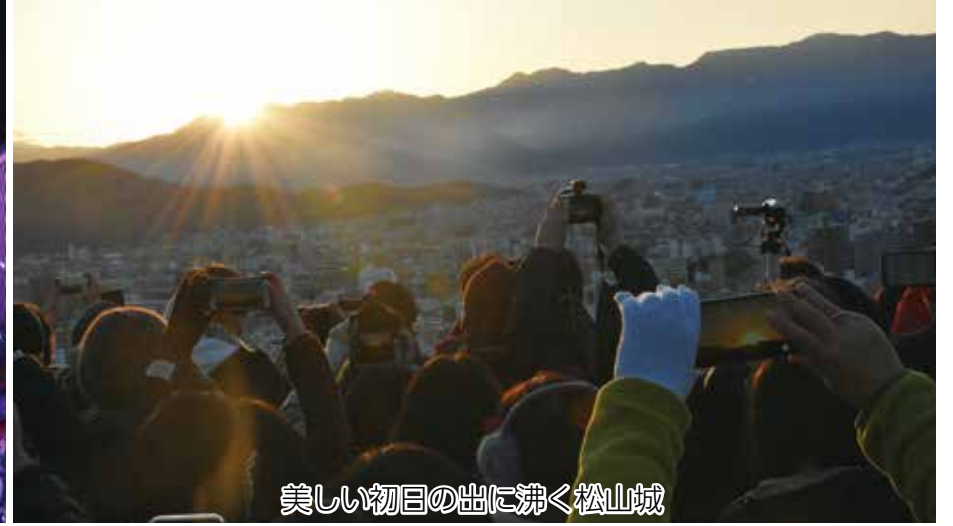
美しい初日の出に沸く松山城