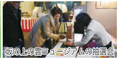
坂の上の雲ミュージアムの抽選会

“平成最後”の年末年始 本市でも、道後温泉本館前でのカウントダウンや松山城での元日イベントなどに多くの人が訪れました。