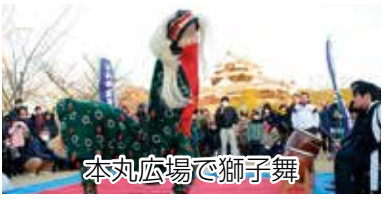
本丸広場で獅子舞

“平成最後”の年末年始 本市でも、道後温泉本館前でのカウントダウンや松山城での元日イベントなどに多くの人が訪れました。