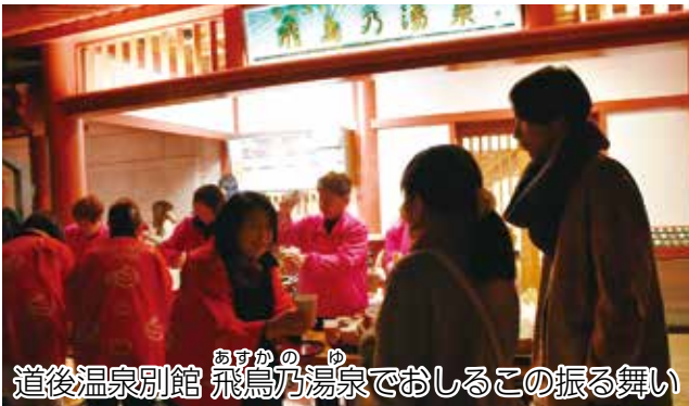
道後温泉別館 飛鳥乃湯泉でおしるこの振る舞い