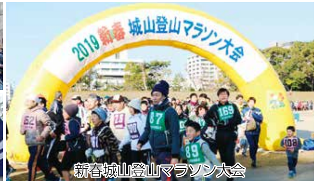
新春城山登山マラソン大会