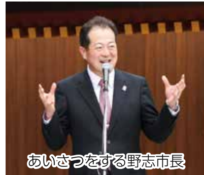
あいさつをする野志市長