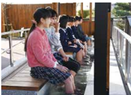
小学生の足湯体験