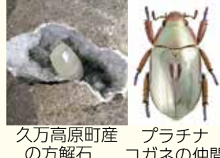
久万高原町産の方解石 プラチナコガネの仲間

日時 7月20日(土)～9月1 日(日)9時30分～17時 ※毎週月曜日休館。ただ し8月12日は臨時開館 会場 面河山岳博物館 (久万高原町若山) 料金 一般450円、小・ 中学生250円 問 面河山岳博物館 ☎0892-58-2130