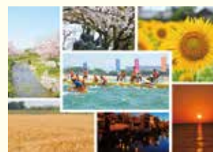
松前町の魅力イメージ