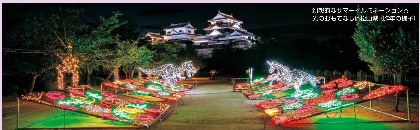
幻想的なサマーイルミネーション☆ 光のおもてなし in 松山城 (昨年の様子)

松山城と「ひろしまドリミネーション」の特別企画「光のおもてなし in 松山城」を今年も開催します。 登城道や石垣を光の散歩道として演出するとともに、「ひろしまドリミネーション」の光のオブジェを多数設置して、松山城を幻想的に彩ります。 日時 7月12日(金)～8月14日(水)18時30分～21時30分 会場 東雲口登城道～松山城本丸広場