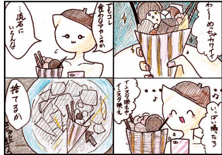
昨年度の中学生の部優秀作品「インスタ映え」

申 問 令和2年3月15日(日)(消印有効)。直接または郵送・eメール。応募票(市青少年センターロビーまたは同センター HP https://www.mbyc.jp/ にあり)を〒790-0864 築山町12-33市青少年育成市民会議 ☎907-7826、943-3346・FAX907-7827・E-mail info@mbyc.jpへ