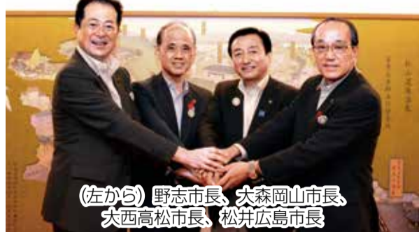
(左から) 野志市長、大森岡山市長、大西高松市長、松井広島市長

観光振興など共通の長所を生かして相乗効果を発揮しています。二巡目の開催にあたり、第1回の開催地を