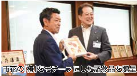
市花の「椿」をモチーフにした記念品を贈呈