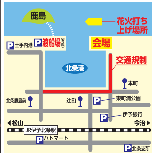
交通規制と会場図

☎風早海まつり実行委員会(北条商工会内) ☎993-0567・☎993-1718