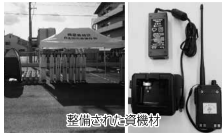
整備された資機材

(一財)自治総合センターの宝くじ受託事業収入を財源とした地域防災組織育成事業により、興居島地区自主防災連合会および桑原地区自主防災組織連合会に、災害時の活動で使用するテントや無線機などが整備されました。