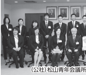
(公社)松山青年会議所の皆さんと野志市長ら