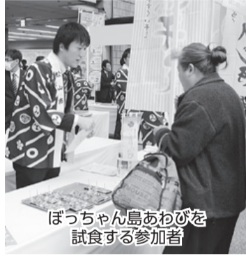
ぼっちゃん島あわびを試食する参加者

会場にはまつやま農林水産物ブランドの試食コーナーも設けられ、「紅まどんな」や「ぼっちゃん島あわび」などの特産品で会場を訪れた人たちをもてなしました。