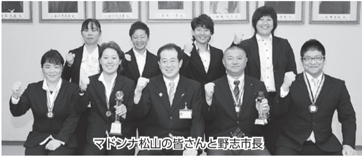
マドンナ松山の皆さんと野志市長