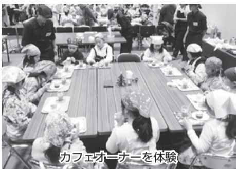
カフェオーナーを体験

市内の小・中学生に仕事を体験してもらい、働くことの楽しさや厳しさを学び、地元企業への関心と理解を深めてもらおうと平成29年12月17日、「キッズジョブまつやま」が実施された。