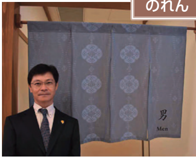
伊予かすり (松山市) <伊予織物工業協同組合>