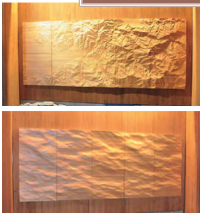
媛ひのきデコラパネル (松山市) <河野興産株式会社>