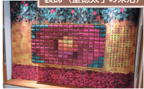
今治タオル (今治市) <株式会社藤高>