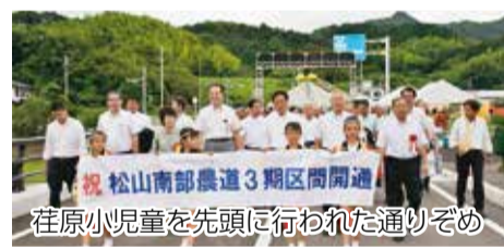
祝 松山南部農道3期区間開通 荏原小児童を先頭に行われた通りぞめ

県営農地整備事業として、平成8年度から整備を進めている松山南部農道のうち、3期区間である松山市浄瑠璃町の県道久谷森松停車場線から松山市東方町の県道三坂松山線までの間が開通しました。松山南部農道は、砥部町宮内から松山市東方町を経て東温市上村に至る基幹農道で、全線が開通すれば全長約5.9kmの2市1町を結びます。