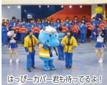
はっぴーカバー君も待ってるよ！

【日時・内容】 11月3日(金・祝)▶9時～9時55分＝「第1部(式典)」市長表彰、少年消防クラブの「誓いのことば」▶9時55分～12時5分＝「第2部(防災シンポジウム)」基調講演、パネルディスカッション▶12時5分～12時35分＝「第3部(アトラクション)」市消防団音楽隊&愛媛大学チアリーディング部(トラスターズ)、幼年消防クラブ員▶10～16時＝「各種体験コーナー」住宅防火啓発コーナー、救助隊による訓練展示、放水体験、ロープ渡り体験ほか▶10時30分～＝女性防火クラブ員による飲食物販売▶11時～＝各種防火・防災体験コーナーのスタンプラリー(記念品あり)、フリーマーケットほか 【会場】 総合コミュニティセンター(湊町七丁目)▶第1～3部はカメラアホール 【料金】 無料