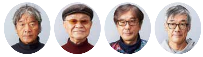
椎名誠さん 早坂暁さん 中沢新一さん 高橋源一郎さん