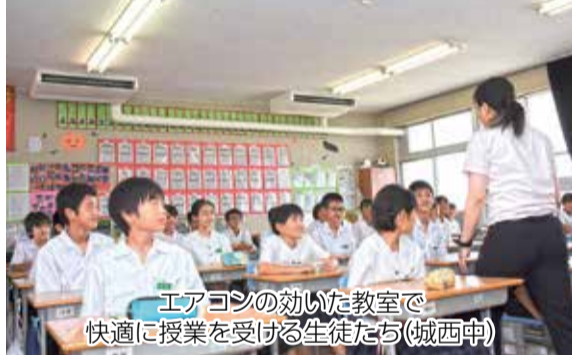
エアコンの効いた教室で快適に授業を受ける生徒たち(城西中)

本市では教育環境の改善のため、小・中学校83校の普通教室と使用頻度が高い特別教室にエアコン整備を進めています。このたび、2学期(9月1日)から設置完了した中学校全29校と島しょ部の小学校3校のエアコンの使用を開始しました。また、島しょ部以外の小学校は、平成30年度中の使用開始を目指して引き続き整備を進めていきます。