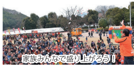
家族みんなで盛り上がるよ!