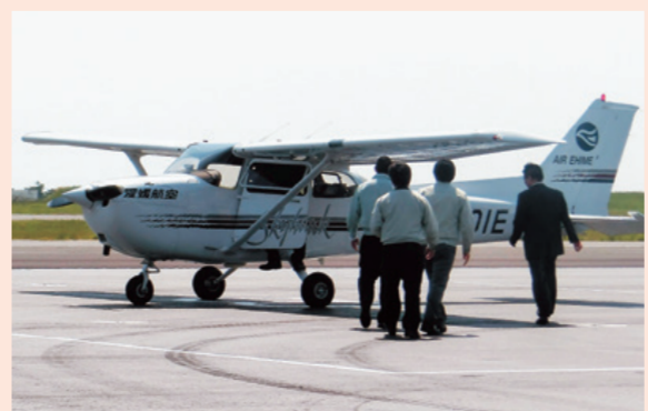
違法なごみの処分を監視するスカイパトロール

ごみの不法投棄や野外焼却などの発見には、市民の皆さんからの情報提供も大切ですので、目撃した場合は、市へ連絡をお願いします。