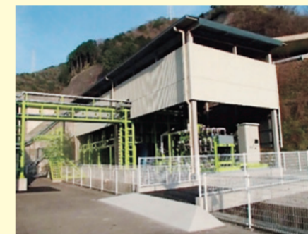
横谷埋立センターエコ次亜生成施設

横谷埋立センター(食場町)では、家庭から排出される埋立ごみやごみの焼却施設から出る灰を埋め立て処分しています。この埋め立て場から染み出てくる水をきれいにする過程で出た塩は、これまで廃棄物として市外へ搬出し処分していました。今回、その塩を原料にしてエコ次亜と呼ばれる消毒剤を製造するリサイクル施設を新設し、現在本格稼働しています。製造したエコ次亜は市の下水処理場である西部浄化センター(南吉田町)で市販の消毒剤の代わりに使用します。これら一連のリサイクルシステムは、日本で初めての取り組みです。