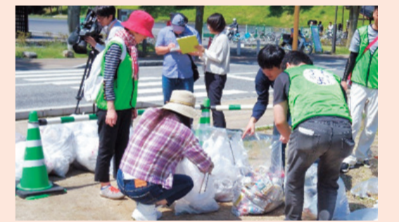
図 環境モデル都市推進課 ☎948-6434 ・ ☎934-1861