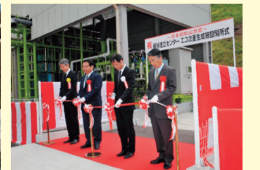
エコ次亜生成施設開所式