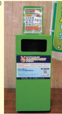
図 清掃課 ☎921-5516 ・ ☎921-6311