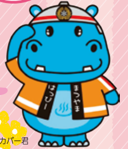
はっぴーカバー君

この企画では伊予市・東温市・久万高原町・松前町・砥部町のイベントなどの情報を発信します。松山からちょっと足を延ばして、地域の魅力を探してみませんか!