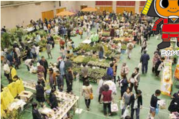
美しい花と緑にあふれる会場の様子

伊予市花まつり推進委員会事務局(伊予市産業建設部経済雇用戦略課内) ☎982-1111(内線573)