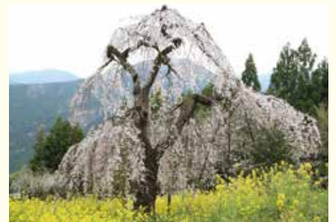
西村大師堂のしだれ桜