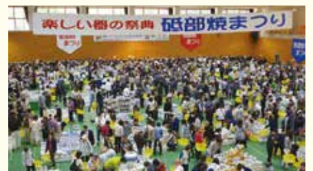
砥部焼まつりでお気に入りの器探し