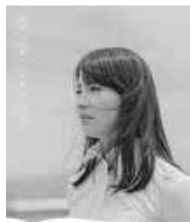
坊っちゃん文学賞

住所、氏名、年齢、電話番号を、〒790-8571文化・ことば課(市役所本館5階) bocchan@city.matsuyama.ehime.jp へ 申 文化・ことば課 ☎948-6634・☎934-1287