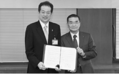
協定を締結した谷川取締役社長(右)と野志市長

※松山城山ロープウェイは4月1日(土)~2日(日)の間21時まで営業します。時間や会場を変更する場合があります