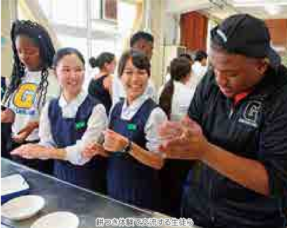
餅つき体験で交流する生徒ら

今回、副市長とともに本市を訪れたのは、松山商業高校と姉妹校提携を結んで10年を迎えたグラント・ユニオンハイスクールの生徒でマーチング・ドラム部「ドラムライン」の部員14人。生徒らは14日、同校を訪問。全校生徒に大きな拍手で迎えられ、翌日に控えた「みんなの生活展」で披露する合同演奏の練習、餅つき体験などを行いました。また、サクラメント市は世界的なアーモンドの産地であること、松山商業高校は野球が盛んであることから、同校経済調査部が野球ボールの形をしたオリジナルのアーモンドクッキーをプレゼントし、両校の絆をより一層深めました。