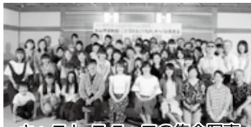
キャスト・スタッフの集合写真

内容 「ことばのちから」をテーマにしたシンポジウム、キャスト・スタッフを市民から公募して制作した映画「ことばのおくりもの」の上映(入場無料)