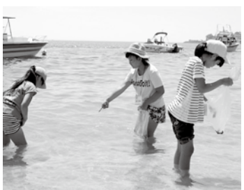
「島のかけら」を探す子どもたち

島の自然や魅力を感じながらアートを学ぶワークショップを通じて、小・中学生がクリエイティブを身近に感じられるARTISLAND 2016が8月11日に興居島で開催されました。