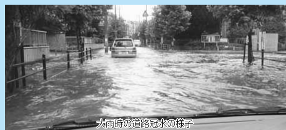
大雨時の道路冠水の様子

近年頻発する局地的大雨による道路冠水被害を軽減するため、地下に雨水貯留槽(1,800 m 3 )を整備しました。