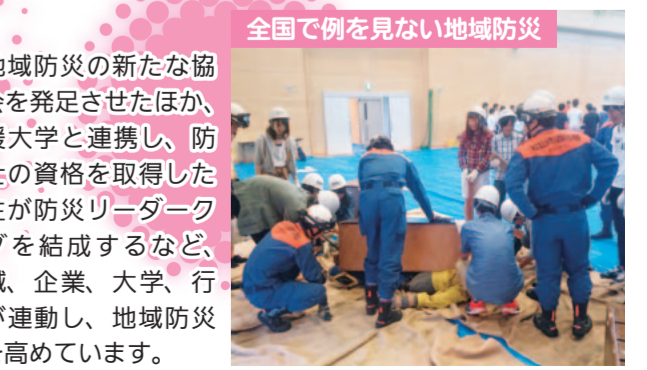
全国で例を見ない地域防災