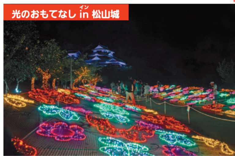
7月18日～8月9日、広島市の協力を得ながら光のトンネルや花畑など大小14のオブジェを設置するとともに、石垣や囃門前の樹木をLEDで飾りました。