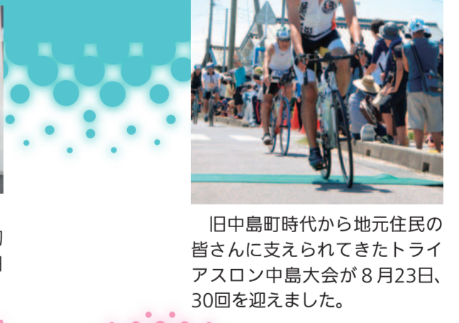
旧中島町時代から地元住民の皆さんに支えられてきたトリアスロン中島大会が8月23日、30回を迎えました。