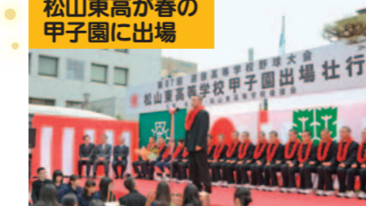
松山東高等学校が選抜高等学校野球大会に82年ぶりに出場、甲子園での活躍に多くの市民が熱狂しました。