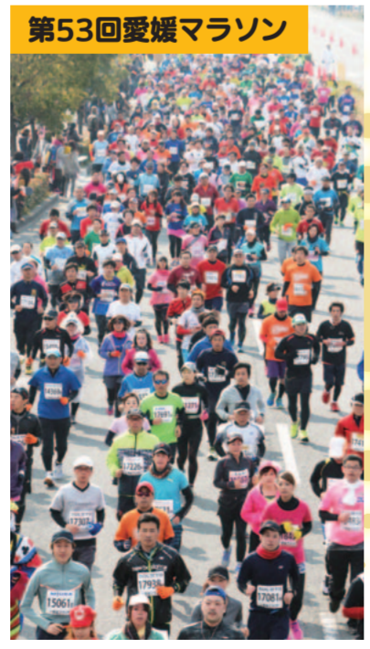
2月8日、史上最多となるランナー9,937人が参加。経済効果は過去最高のおよそ4億4千万円になりました。