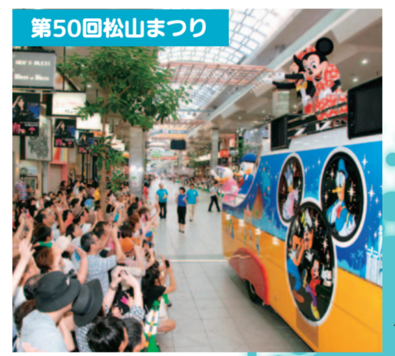
8月7～9日に開催された「松山まつり」は、50回を記念しディズニーの仲間たちのパレードや子ども部門が開催されました。