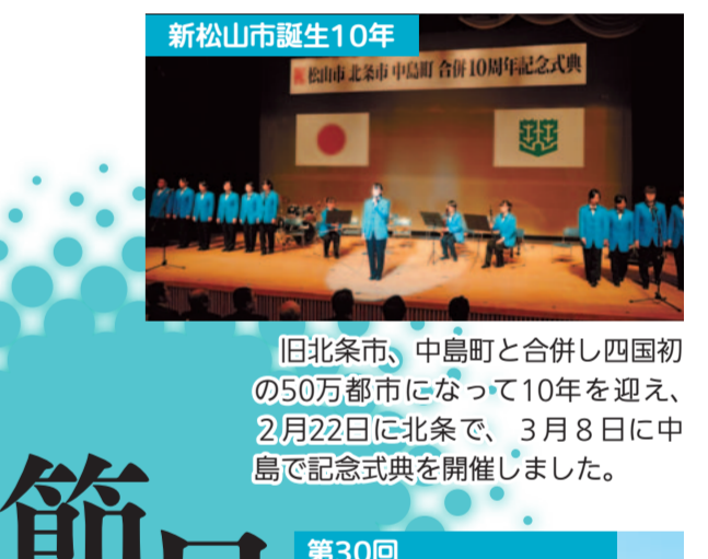
旧北条市、中島町と合併し四国初の50万都市になって10年を迎え、2月22日に北条で、3月8日に中島で記念式典を開催しました。