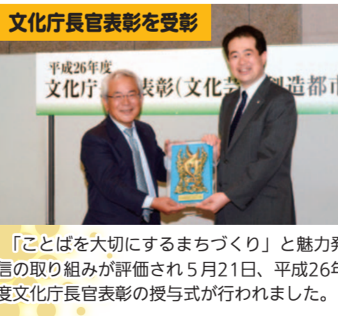
「ことばを大切に作るまちづくり」と魅力発信の取り組みが評価され5月21日、平成26年度文化庁長官表彰の授与式が行われました。