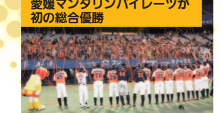
愛媛マングリンパイレーツが初の総合優勝