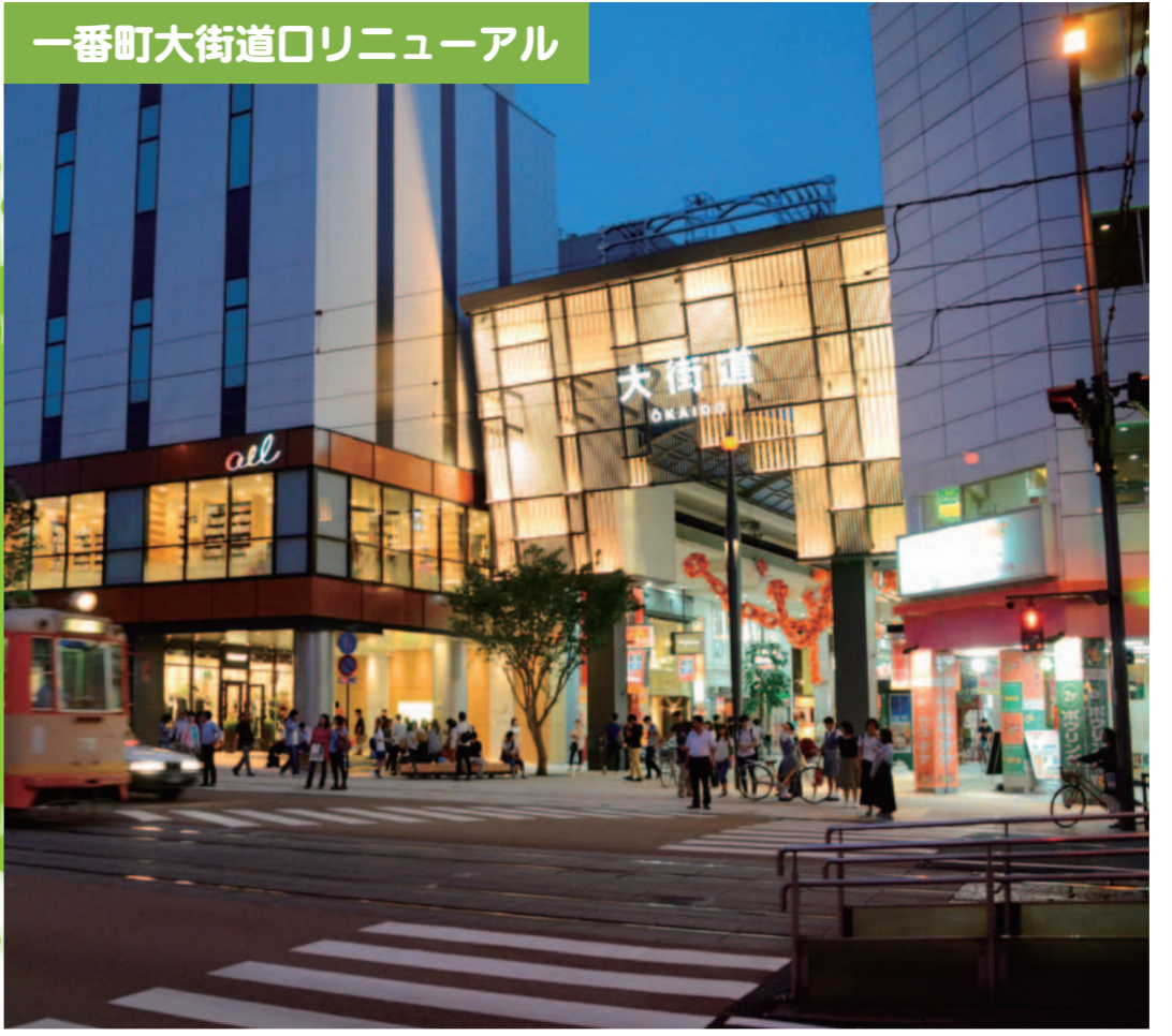
8月26日、「AEL MATSUYAMA (アエル松山)」がオープンし、一番町大街道口が新たな装いに生まれ変わりました。再開発にあわせ、地元商店街が主体になってアーケードをリニューアルし、商店街のアーケード入口付近に開放的な「憩いの空間」を設け待ち合わせなど人が集えるスペースを確保、また国土交通省と連携して周辺道路の景観整備も行いました。