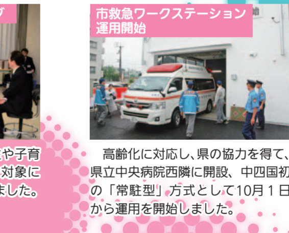
高齢化に対応し、県の協力を得て、県立中央病院西隣に開設、中四国初の「常駐型」方式として10月1日から運用を開始しました。