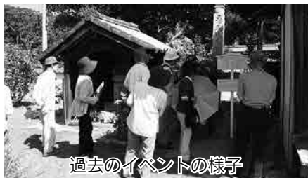
過去のイベントの様子

日 12月13日(日)9時15分～15時30分 ▶ 集合・解散＝市役所第四別館(三番町六丁目)