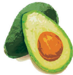
松山市は国産アボカド生産面積全国1位！

総合コミュニティセンター（湊町七丁目）キャメリアホール サミット担当事務局（農業指導センター内） ☎976-1199・FAX 970-3915