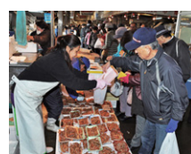
瀬戸内の新鮮な海の幸が並ぶ

11月28日（土）9～12時 水産市場（三津ふ頭） 魚介類の大試食会（先着2,000食）・販売、タイやヒラメなどの釣り堀（小学生以下対象）、模擬せり、地元協力店の出店、餅まきなど ※内容については一部変更の可能性あり ※魚介類の販売は売り切れ次第終了