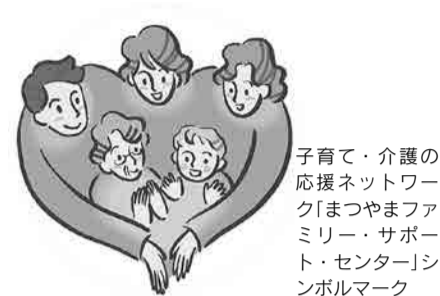
子育て・介護の 応援ネットワ ク「まつやまフ ミリ-サポー ト-センター」シ ンボルマーク

子育て・介護の「お手伝いをした い人(提供会員)」を登録し、援助活 動を行うための①説明会②講習会 ①=11月4日(水)10～11時▶② =育児は11月17日(火)～20日(金)10 ～15時(19日(木)は9～15時)、介 護は25日(水)10～15時、育児・介 護共通は26日(木)9～12時・27日 (金)10～15時 コムズ(三番町六丁目)4階視聴覚 室(26日(木)のみ市保健所・消防合同 庁舎(萱町六丁目)) 子育て・介護のお手伝いをしたい 人 ①=当日参加可▶②=11月10日 (火)(必着)。直接または電話・ファク ス・eメール。住所、氏名、電話番 号をまつやまファミリー・サポー ト・センター ☎ event@coms.or.jp へ ※②は託児(1人200円～)あり まつやまファミリー・サポー ト・センター ☎945-1008 ・ FAX943-04 60