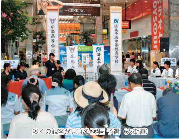
多くの観客が見守る22日予選(大街道)