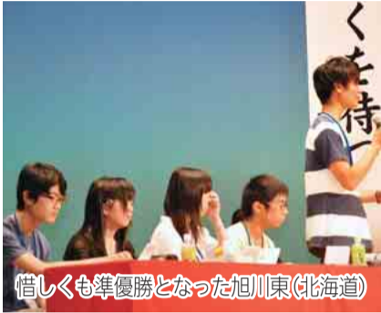
惜しくも準優勝となった旭川東(北海道)