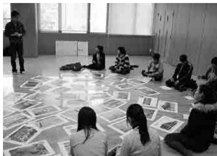
チャレンジプロジェクト対象のイベント

対 市内在住の中学1・2年生 用 9月30日(水)まで ※ 詳細はお問い合わせください 問 まつやま国際交流センター ☎943-2025・FAX 931-2041