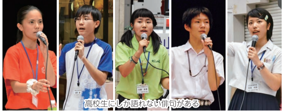
高校生にしか語れない俳句がある