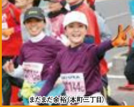
まだまだ余裕(本町三丁目)