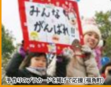
手作りのプラカードを掲げて応援(福角町)