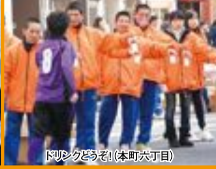
ドリンクどうぞ!(本町六丁目)