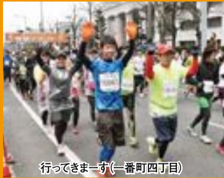
行ってきまーず(一番町四丁目)

第53回愛媛マラソンが2月8日に行われ、最多となるランナー9,937人が伊予路の風になりました。