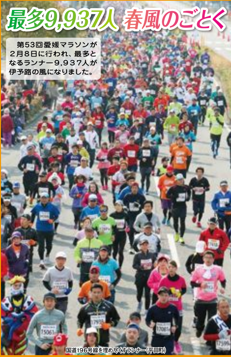
国道196号線を埋め尽くすランナー(平田町)