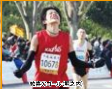
歓喜のゴール(堀之内)