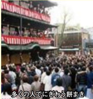
多くの人でにぎわう餅まき

道後に春を呼ぶ「道後温泉まつり」を3月19日(木)~23日(月)に開催します。今回は初めて「花」をテーマに、さまざまな花のアート作品が披露目されます。楽しいイベントが満載ですので、ぜひお越しください。 ※公共交通機関をご利用ください