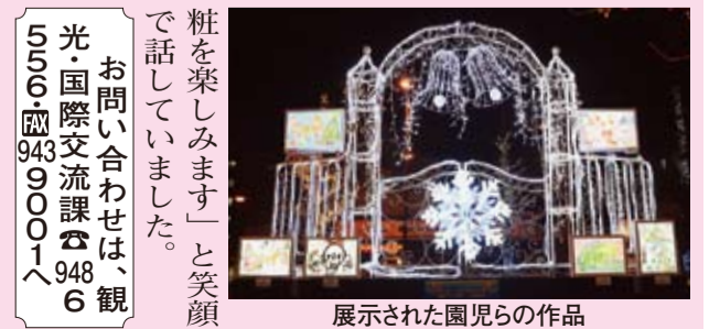
展示された園児らの作品

イルミネーション「花園」が2014年のクリスマスイベント「花園ばるく」が平成26年12月20・21日に開催されました。クリスマススクラフトのワークシートを配布し、親子でスクラフト作りを行いました。妖怪?が多数出没