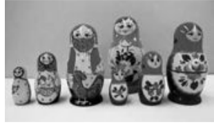
自分だけのオリジナルを作ろう

各開催日の前日(必着)。電話・はがき・ファクス・eメール。住所、氏名、電話番号、参加希望日、参加人数を7900001一番町三丁目20坂の上の雲ミュージアムマトリョーシカイベント係@sakakumomuseum@yon-b.co.jpへ