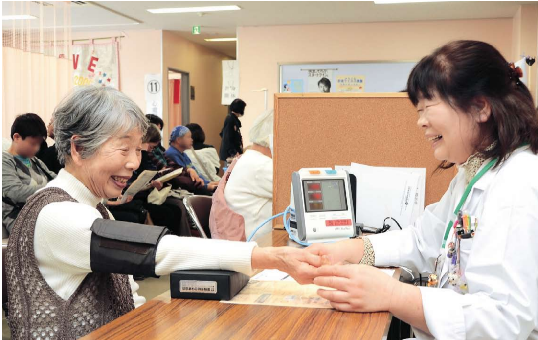
定期的な健診を、生活習慣病の早期発見・予防に役立てましょう

発行：松山市役所／編集：総合政策部広報課／毎月1日・15日 ☎ 948-6705 FAX 934-2578 HP http://www.city.matsuyama.ehime.jp/ 市勢 平成26年4月1日 現在推計(前月比) ■面積：429.06㎢ ■人口：514,763人(-1,607) ■男：239,981人 ■女：274,782人 ■世帯数：229,973世帯(+108) ■1世帯の平均：2.24人 ■人口密度：1,200人/㎢