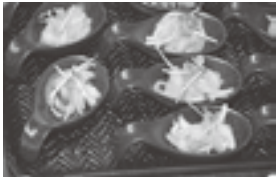
しまのわ道後朝飯(イメージ)