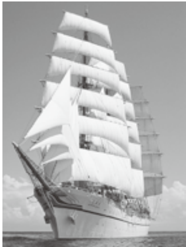
大型帆船「日本丸」が寄港!

【内容】①島の海産物・農産物などを集めた「物産市」や「しま屋台」などのグルメ市場②大型帆船「日本丸」、海上自衛隊艦艇が寄港