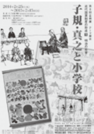
第8回企画展は平成27年2月15日(日)まで開催中

お問い合わせは、「瀬戸内しまのわ2014」実行委員会 愛媛県本部松山事務所(県中予地方局内)☎909-8760、坂の上の雲まちづくりチーム☎948-6816・☎934-1804へ