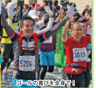
ゴールの喜びを全身で!