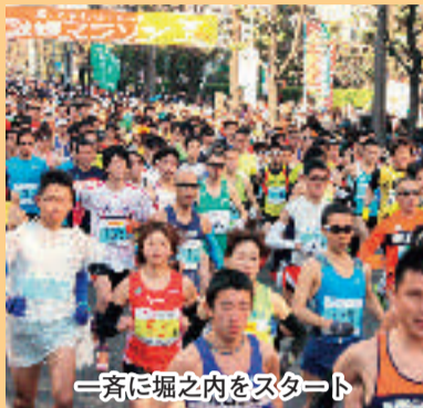
一斉に堀之内をスタート