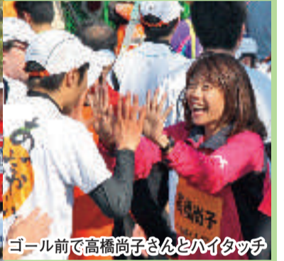
ゴール前で高橋尚子さんとハイタッチ