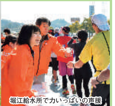
堀江給水所で力いっぱいの声援