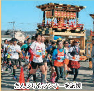
だんじりもランナーを応援