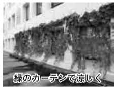
緑のカーテンで涼しく

〔会〕夏の節電・ 温暖化対策に 有効で、涼し さを演出する 「緑のカーテ ン」の更なる 普及のため、来年度に配布す る種を募集しています。ぜひ お譲りください。 〔会〕9月18日(火)～12月28日(金)消 印有効。直接または郵送。 〒790 8 5 7 1 環境事業推進課 (市役所別館4階) または支 所へ 〔会〕環境事業推進課 948 6 4 3 7・934 1 8 6 1