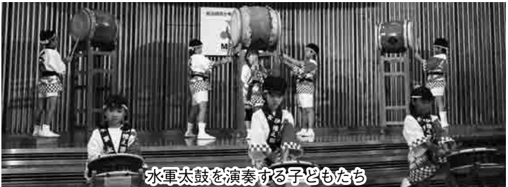
水軍太鼓を演奏する子どもたち

【申し込み】9月25日(火)17時(必着)までに、はがきまたはファクス・eメールで、団体名、ジャンル、演目、希望の出演時間帯、参加人数、代表者の住所、氏名、電話番号を〒7900864 築山町12-33 青少年育成市民会議「松山子ども伝統芸能・文化活動大会」係 chief@mybc.jpへ お問い合わせは、青少年育成市民会議 ☎9077826・FAX9077827(教) 教育支援センター事務所 ☎9433346・FAX9477911へ