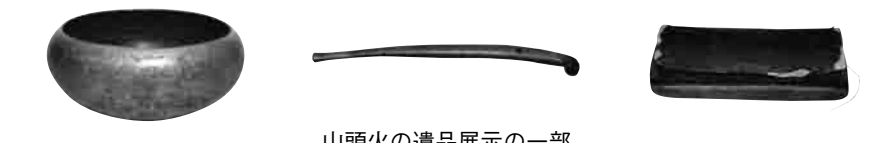
山頭火の遺品展示の一部

【日時】10月1日(月)9~17時(来松日)、10月11日(木)9~17時(命日) 12月15日(土)9時~16時30分(入庵日) 【場所】一草庵(御幸一丁目) 【料金】無料