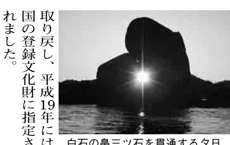
白石の鼻三ツ石を貫通する夕日

地区の北端、白石の鼻の沖には大きな石が積み重なり、春分・秋分の日前後に、三ツ石の空洞部分に夕日が重なる神秘的なスポットとして、近年注目を集めています。地元の人たちはここで夕日の鑑賞会を開催するなど、地域の宝を磨く活動に取り組んでいます。