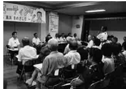
地区の課題を話す参加者

8月9日開催・高浜公民館・参加者61人 地区の方の声 ・緑豊かな地域で、特に夕日が美しい ・市のイメージアップになるような、町名や番地などに変更することはできないか ・ふれあい・いきいきサロン事業の利用者をもっと増やしたい ・災害時の放送設備が海側にあり聞こえにくい場所があるが、デジタル化でどの程度改善されるのか ※抜粋、要約しています。詳細は市ホームページに掲載します