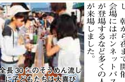
全長30mのそうめん流しに子どもたちは大喜び

7/22 かざはや楽市 北条駅前夜店祭り JR北条駅前通りを約25年ぶりに歩行者天国とし、朝から夜まで開催。会場にはボンネットバスが登場するなど多くの人々が来場しました。