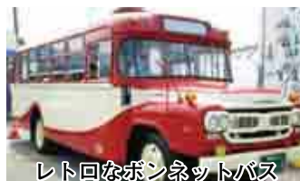
レトロなボンネットバス