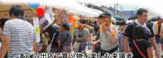
多くの出店で買い物を楽しむ来場者

7/22 かざはや楽市 北条駅前夜店祭り JR北条駅前通りを約25年ぶりに歩行者天国とし、朝から夜まで開催。会場にはボンネットバスが登場するなど多くの人々が来場しました。