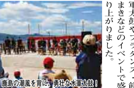
鹿島の潮風を背に、勇壮な水軍太鼓!

7/16 こ夏鹿島!海開きフェスタ2012 鹿島の夏の始まりを告げる当フェスタでは、水軍太鼓やフラダンス・餅まきなどのイベントで盛り上がりました。