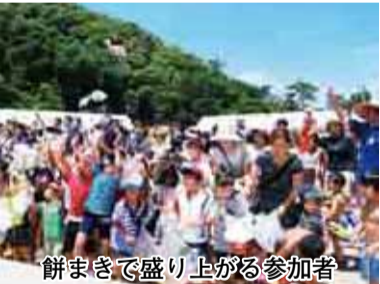
餅まきで盛り上がる参加者

北条地域の活性化を目指す「風早レトロタウン構想」に関連して、鹿島やJR北条駅前通りに昭和のころのにぎわいをよみがえらせようと、イベントが開催されました。