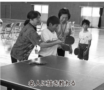
名人に技を教わる

桑原の名人に学ぶ 集まっていたいたいたしたのは、バトントワリング、料理、英会話、空手、獅子舞、卓球、手芸、リサイクル工作、リース作り、漬物、中国語、パンプラワー、日本舞踊、生け花、編み物の15分野の名人で、皆さん地域で教室を開いている人や児童の保護者です。名人の手柄と技に触れる名人がその技を身に付けたきっかけや、今もどんな気持ち