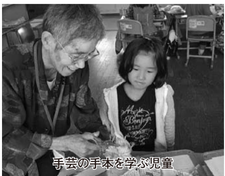
手芸の手本を学ぶ児童

短い時間でしたが、今まで知らなかった名人の手柄や技に触れ、充実した活動になりました。今後は、グループごとにそれぞれの名人について調べたことや感じたことをまとめ、他の友達に発表することや、桑原の名人のすごさや桑原のまちの魅力に気付くことができると思います。