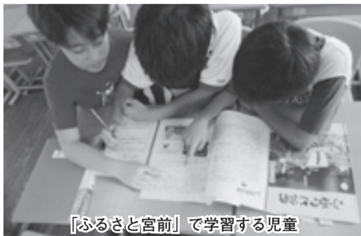
「ふるさと宮前」で学習する児童

■追加年金 定額保険料に上乗せして月額400円を納めると、年金受給額が増えます。 ■60歳からの任意加入 年金の未加入や未納期間などがある人は、60～65歳の間に国民年金に任意加入すると年金受給額が増えます。(受給資格期間のない人は70歳まで加入できません) ■追納 免除制度を利用した期間は、10年以内に限り、後から納めることができます。(納めない場合は、年金受給額が少なくなります) お問い合わせは、国保・年金課 ☎9486352・FAX 9342631、松山年金事務所 ☎9462146・FAX 9331319へ