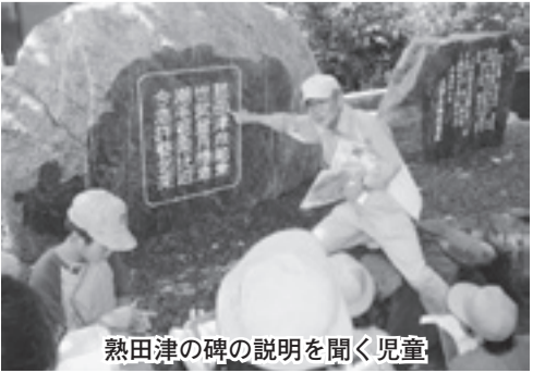
熟田津の碑の説明を聞く児童