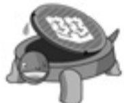
市下水道イメージキャラクター「かめまる」くん

「下水道生きものすべてのいのちのちのわ」を合言葉に下水道の啓発活動を行います。 市下水道イメージキャラクター「かめまる」くん