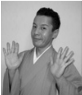
らくさぶろうさん

回9月17日(土)～19日(月)・祝。いずれも9時～18時30分 松坂の上の雲ミュージアム(一番町三丁目) 2階ホール 内17日(土)11時～11時30分、14時～14時30分 18日(日)10時30分～11時、11時30分～12時 19日(月)11時～12時 う一座トーク&大喜利▼18日(日)13時30分～14時、15時～15時30分 紙芝居▼全日 ガラポン大会・ミュージアムカフェでの特別メニューなど