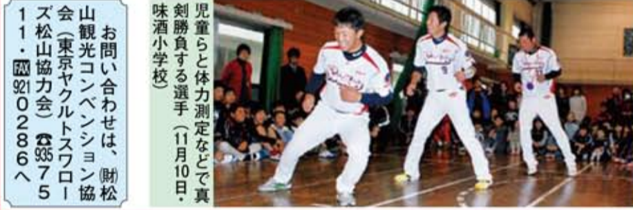
児童らと体力測定などで真剣勝負する選手(11月10日・味酒小学校)

お問い合わせは、(財)松山観光コンベンション協会(東京ヤクルトスワローズ松山協力会) ☎9357511・☎9210286へ